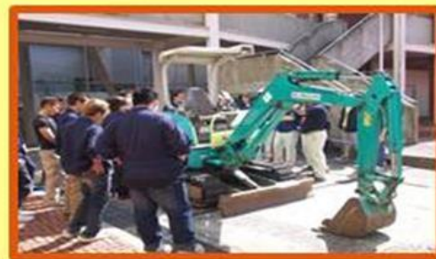
講習会(建設機械特別教育)